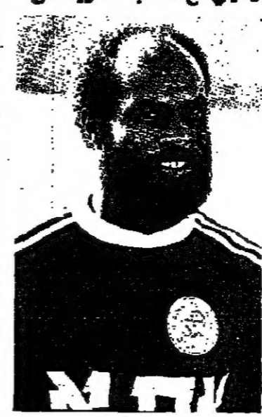
رفعت ترك - راس الحربة للمنتخب الوطني الاسرائيلي

يات التصفية للفوربيكس بطولة العالم في كرة القدم المنتخب الوطني الاسرائيلي مع منتخب السويد على ولم مساء اليوم - سيقبل التفرغون الاداعة باللقمة